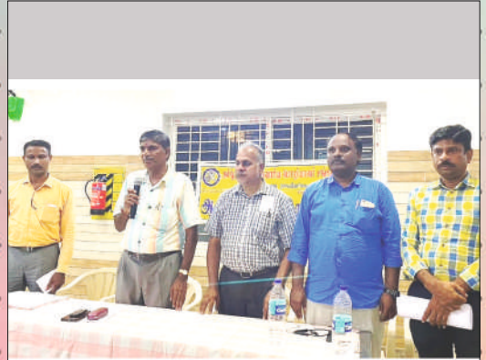
Udumalaipettai - 01.06.2024