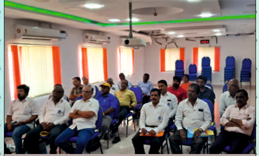
Head Quarters - 16.06.2024