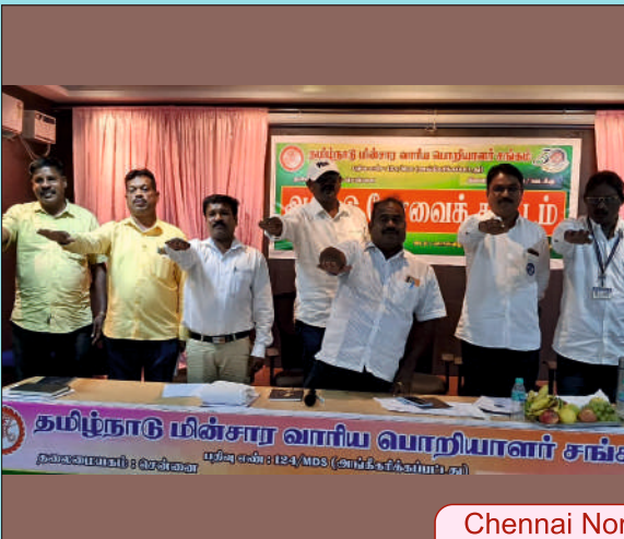
Chennai North - 09.06.2024