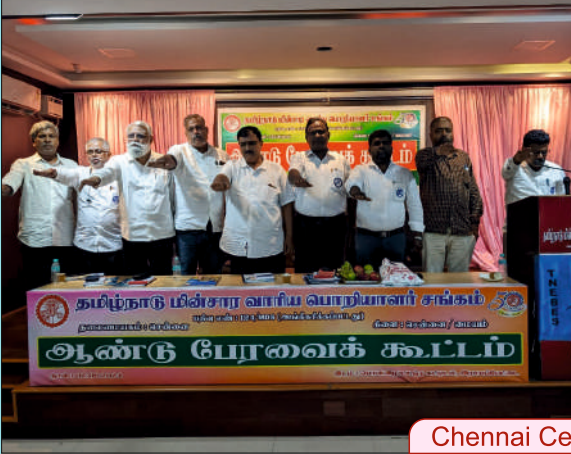
Chennai Central - 02.06.2024