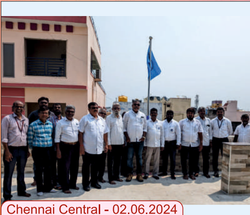
Chennai Central - 02.06.2024