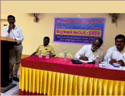
Karur - 20.06.2024